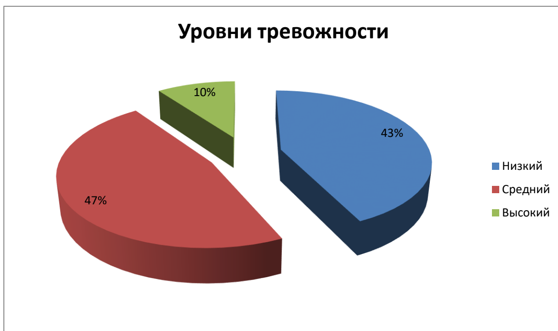
Диаграмма распределения уровней тревожности учащихся 10 класса