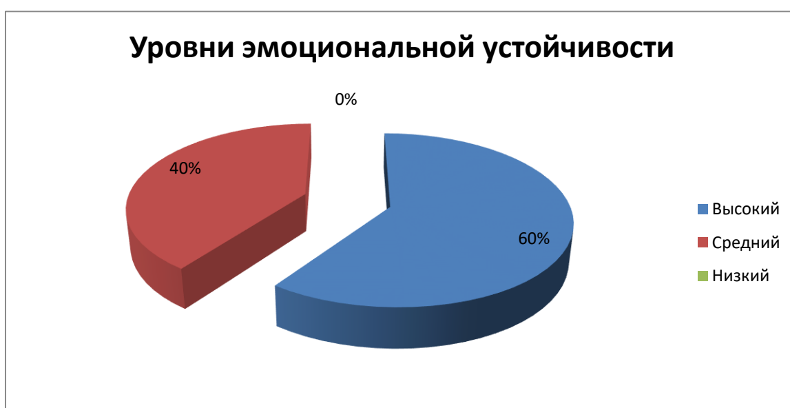
Диаграмма распределения уровней эмоциональной устойчивости учащихся 10 класса